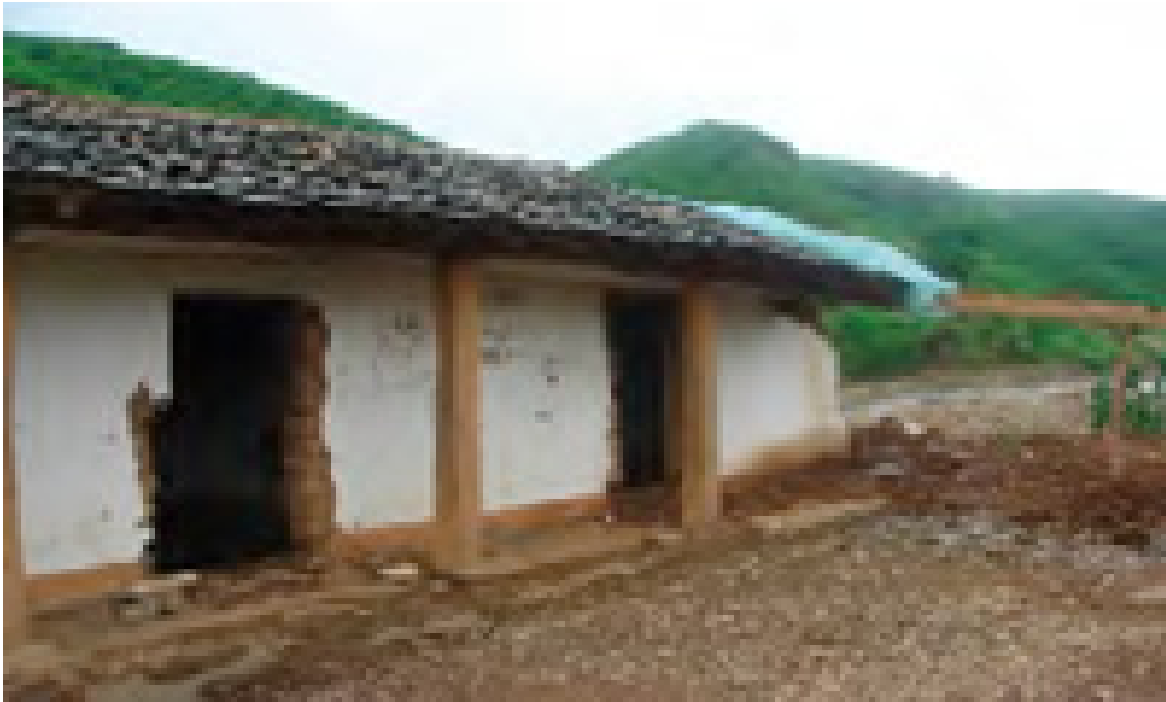
Ein Haus in Nordkorea nach der Flut 2007