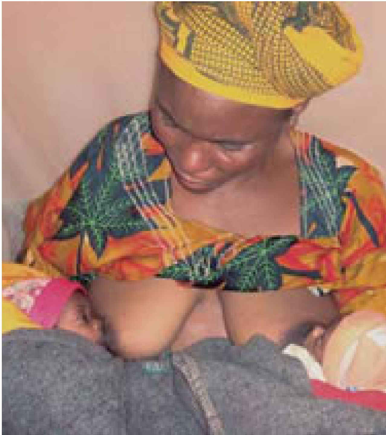
Eine Flüchtlings- mutter beim Stillen von Zwillingen Tansania