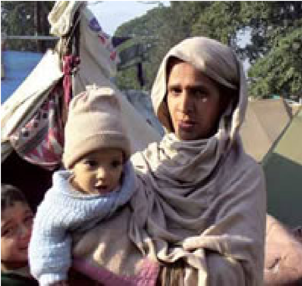
Mutter mit 7 Monate altem Baby nach dem Erdbeben Pakistan 2004