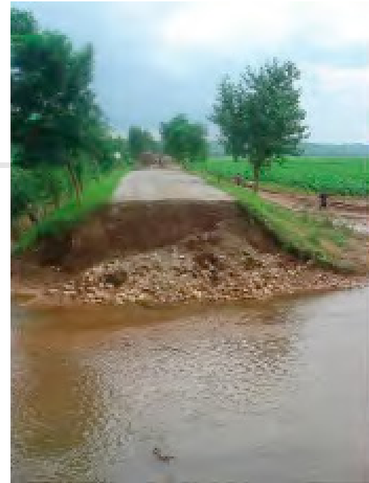
Unpassierbare Strasse nach der Flut Nordkorea 2007