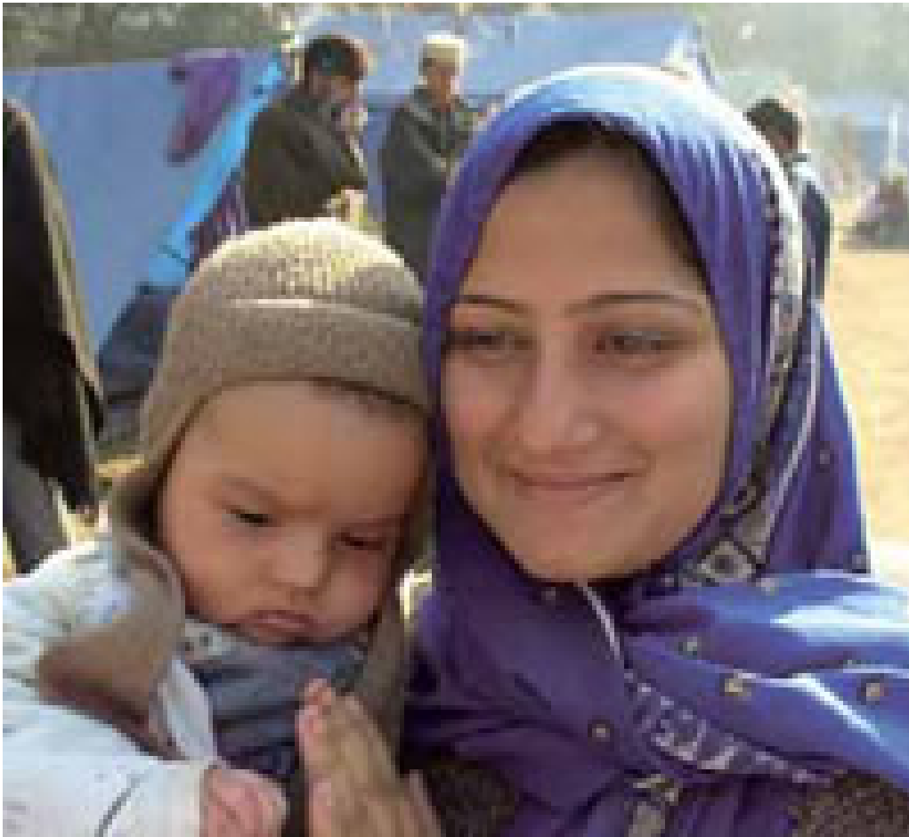
Mutter mit 4 Monate altem Säugling in IDP Lager Jalabad Park, Muzaffarabad, Pakistan Erdbeben 2005