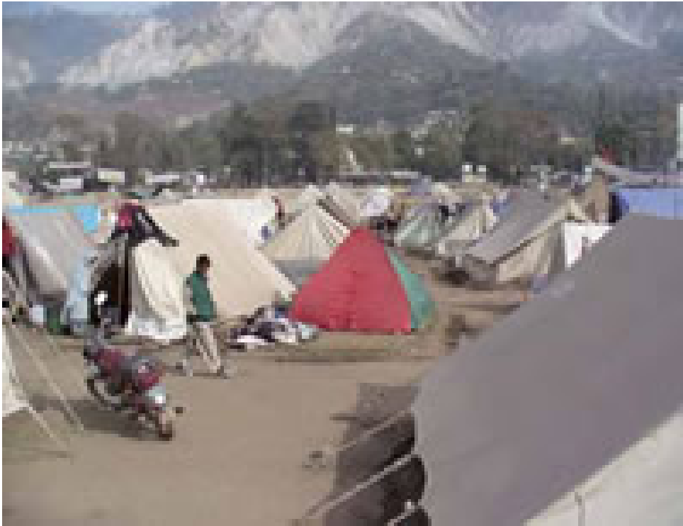
Old University Lager Muz, Pakistan, 2005 Erdbeben